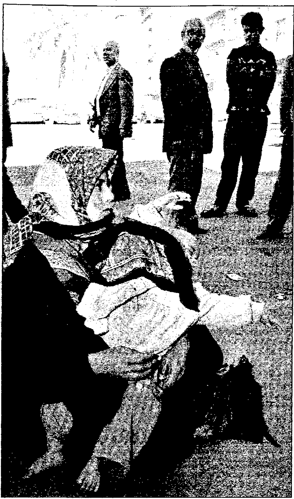
سيدة عراقية تتسول في بغداد